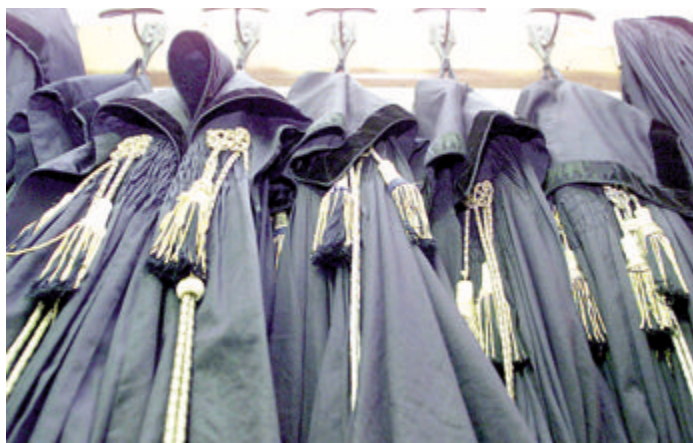
Il progetto sulla legalità prevede anche la simulazione di un processo