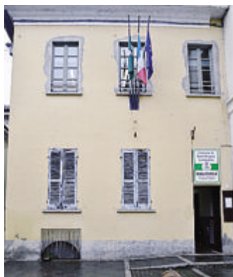
La biblioteca civica "Oriana Fallaci"